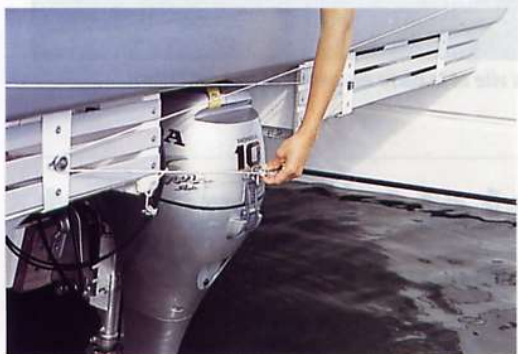
LE CHAISE DU HORS-BORD de 10 ch Honda se relève sans effort au moyen d'un palan. Le capot du moteur est relié aux barres par une drosse pour des manœuvres au moteur beaucoup plus efficaces, surtout au port.