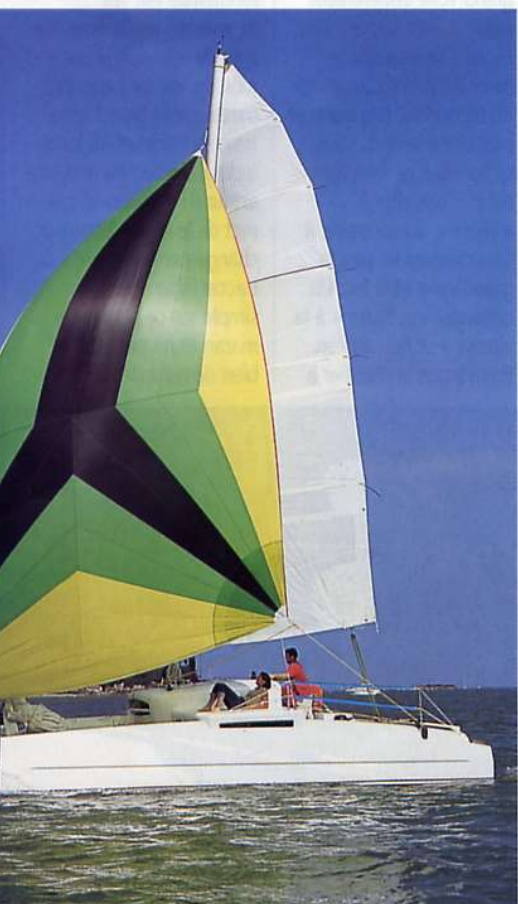
LE SPI ASYMÉTRIQUE est de dimension raisonnable (54 m 2 ) mais bien suffisante pour se faire plaisir.

→ demandent aucun effort aux équipiers. Le foc autovireur limite aussi les manœuvres. Cap sur le bois de la Chaise à Noirmoutier pour beacher. L'arrivée sur le sable au moteur se fait en douceur, les étraves perpendiculaires à la plage. Posé sur ses ailerons, le 4xCat ne risque rien. En arrière et en avant des étraves, des bandes de caoutchouc accentuent ce côté « tout-terrain ».