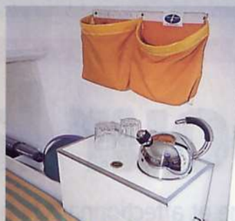
EQUIPETS EN TOILES et mini-cuisine où l'on peut installer un réchaud.

L'AMÉNAGEMENT des flotteurs est en option. Ils peuvent recevoir une couchette simple, un WC chimique, voire une kitchenette.