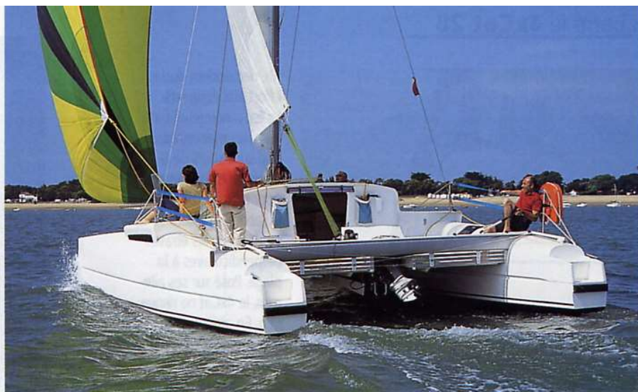
Au portant, sous spi asymétrique, le 4xCat 28 va vite et la barre est généreuse en sensations.